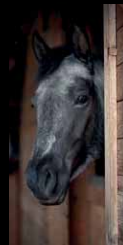
PŘI PRÁCI U KONÍ mladý tvůrce často dostane nápad na nové hodinky.