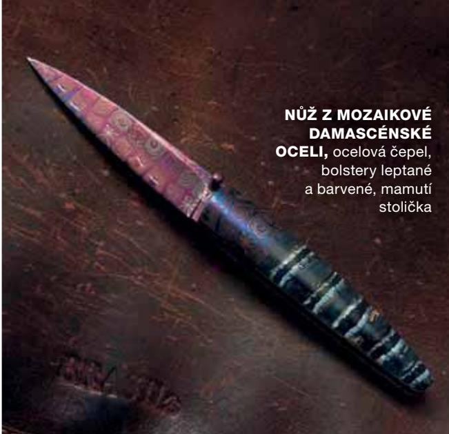
NŮŽ Z MOZAIKOVÉ DAMASCÉNSKÉ OCELI , ocelová čepel, bolstery leptané a barvené, mamutí stolička